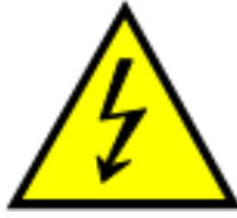
图 1 高压警告标记